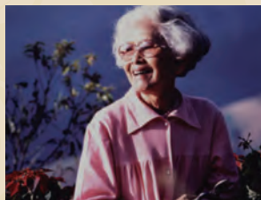
シーナカリン王太后 (1900 ~ 1995年)

メーファールアン財団は、問題の原因と解決札「人」であると信じています。地域社会、環境、文化を發展させ、幸福、持続可能性のある安定を生み出すことを目指しています。