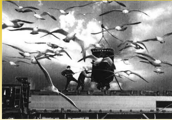
外務大臣賞2020 ©嶋田 洋 ※実際の作品はカラーです