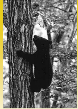
環境大臣賞2020 ©土屋 芳孝 ※実際の作品はカラーです

言葉では言い尽くせないシーンも 写真なら伝えられます。 撮影技術より写す人の心が 感じられる作品を期待しています。