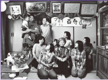
外務大臣賞2019 ©栗原 陽子 ※実際の作品はカラーです。