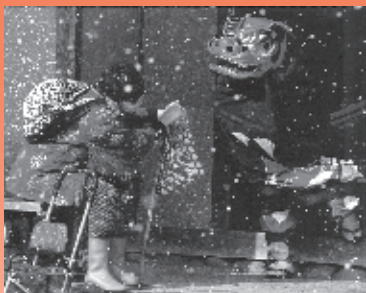
外務大臣賞2015 ※実際の作品はカラーです。

6月1日は「写真の日」 言葉では言い尽くせないシーンも 写真なら伝えられます。 撮影技術より写す人の心が 感じられる作品を期待しています。