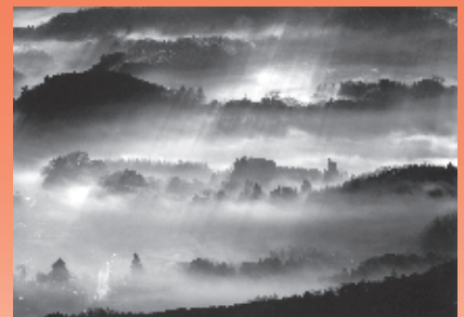
環境大臣賞2015 ※実際の作品はカラーです。

6月1日は「写真の日」 言葉では言い尽くせないシーンも 写真なら伝えられます。 撮影技術より写す人の心が 感じられる作品を期待しています。