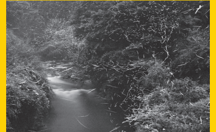
環境大臣賞('12 ネイチャー部門) (※実際の入賞作品はカラー作品です。)

言葉では言い尽くせないシーンも 写真なら伝えられます。撮影技術より写す人の心が 感じられる作品を期待しています。