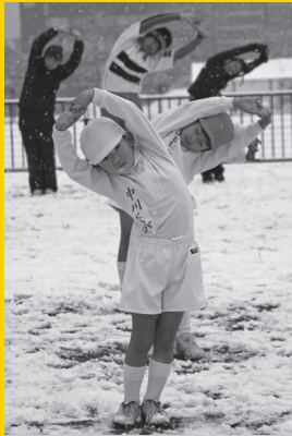
外務大臣賞('12 自由部門)©松本洋子 (※実際の入賞作品はカラー作品です。)