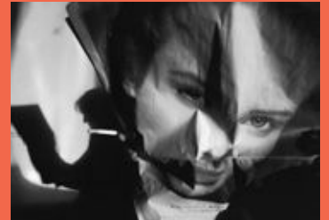
最優秀賞('11 自由部門) ©嶋田 洋

言葉では言い尽くせないシーンも 写真なら伝えられます。撮影技術より写す人の心が 感じられる作品を期待しています。 テーマは自由作品とネイチャーフォトの2部門です。 ヤングフォトグラファー(30歳未満)大歓迎!