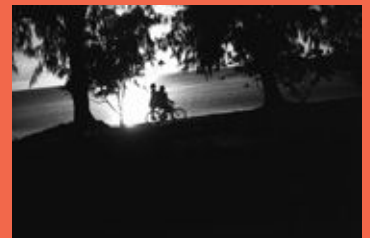
外務大臣賞('11) ©安藤広樹